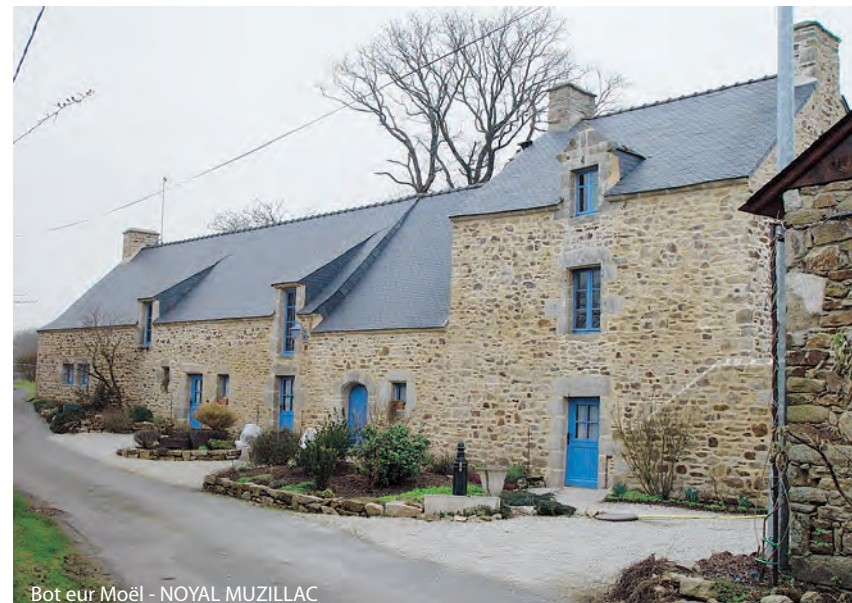
Bot eur Moël - NOYAL MUZILLAC

Au titre de leurs compétences en matière d'aménagement et d'urbanisme, les élus locaux ont un rôle important à jouer pour protéger et mettre en valeur cette richesse patrimoniale, qui faute d'entretien et de mise en valeur tend à se dégrader et à être oubliée. Cette responsabilité est d'autant plus importante en ce qui concerne le patrimoine local qui ne bénéficie pas de protection au titre de politiques nationales et dont la valorisation peut faire l'objet de projets élaborés en concertation avec les acteurs locaux.