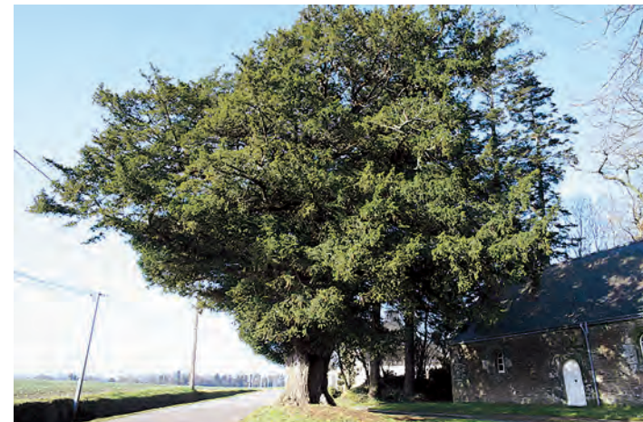
Saint Nicolas - SAINT-JEAN BRÉVELAY