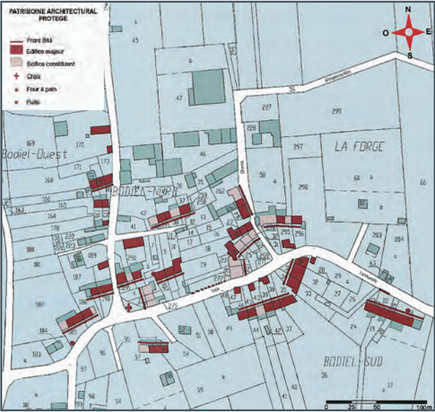
Exemple de recensement du patrimoine architectural