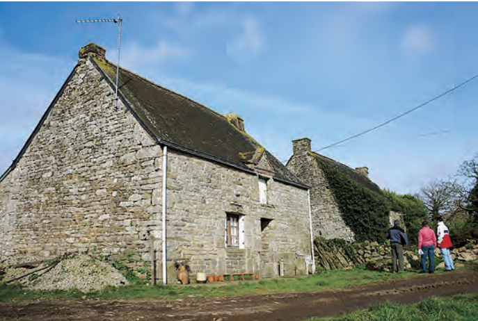
Le Mont - Guéhenno